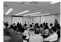
防災マップづくり