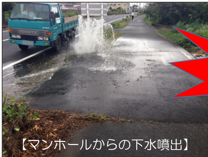
【マンホールからの下水噴出】

【原因】 雨水を流す雨樋などの排水が、「污水管」につながれていることや雨天時に污水ますの蓋を開けて宅内の雨水を排水していること等が原因です。