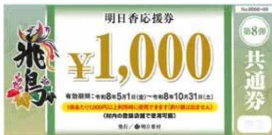
▲村内全登録店舗で使用可能な「共通券」