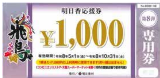
▲コンビニエンスストア・大型スーパーマーケットを除く村内登録店舗で使用可能な「専用券」