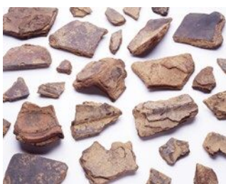
▲夾紵棺片