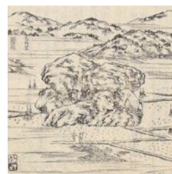
▲『西国三十三所名所圖會』