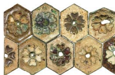
▲七宝製亀甲形飾金具

発掘調査では、夾紵棺（麻布を漆で貼り重ねた棺）の破片や七宝製亀甲形飾金具、ガラス玉、人骨などが出土しました。八角墳と夾紵棺の採用は、この古墳が当時の最高権力者の墳墓であったことを示しています。