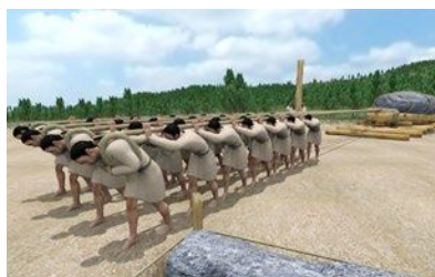
▲石材運搬イメージ