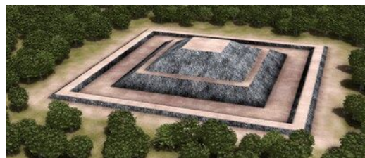
▲石舞台古墳復元イメージ

また、墳丘は中国の皇帝陵の影響を受けて方墳となった一方で、埋葬施設には横穴式石室や石棺・周溝など、日本の伝統的な墓制を踏襲しています。このことは、新たに伝来した造墓思想と日本の伝統的な葬法との融合を表しています。