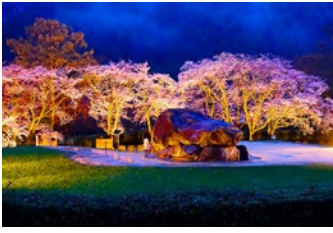
▲美しい夜桜と古墳をぜひご覧ください