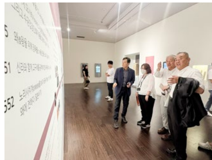
▲国立扶餘博物館内

また、10月29日(水)～31日(金)の3日間、扶餘郡守・扶餘郡議会議長をはじめとした訪問団が明日香村を訪れました。