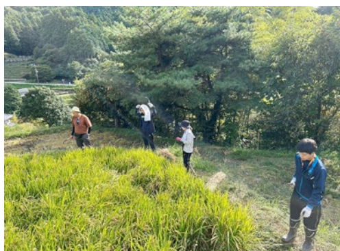
▲ 機械の入れない棚田で手刈り

農繁期で人手の足りない農家と体験機会を求める学生をマッチングする試みとして、今後の活動も期待のできる内容となりました。