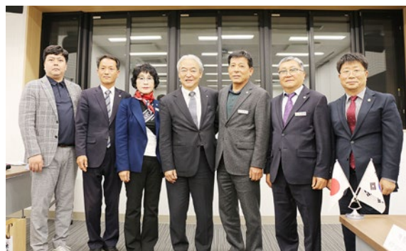
▲扶餘郡議会の皆さま