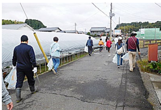
▲美しい村を目指して