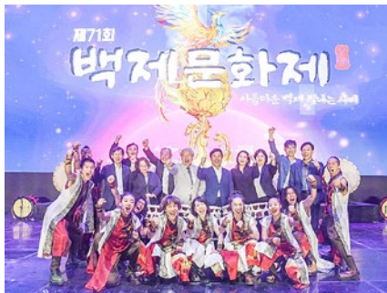
▲百済文化祭『和太鼓 倭』