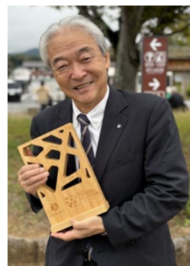
▲ トロフィーと記念撮影