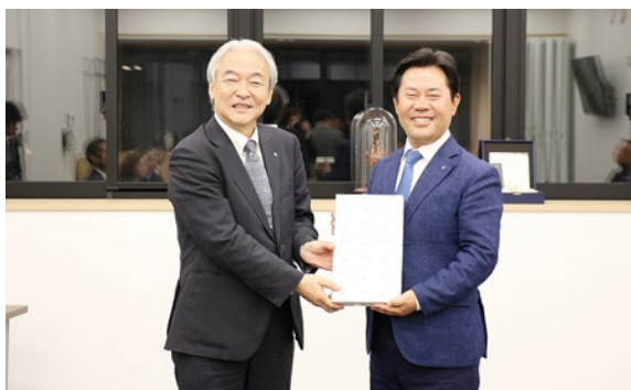
▲(左) 森川村長 (右) パク郡守

村長から、『飛鳥・藤原の宮都』が世界遺産登録された折には、『百済歴史地区』と世界遺産としてのつながりを世界各国へPRし、互いに高め合えるよう尽力したい。」とお伝えしました。