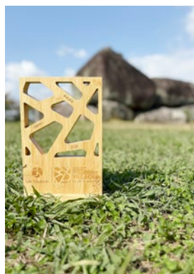
▲ 木製のトロフィー