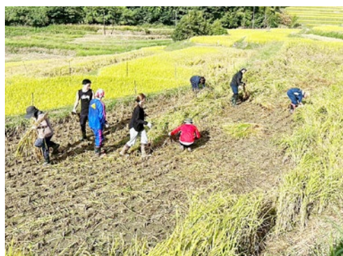
▲ 田んぼの雑草を引きながら収穫