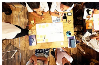
◀ 飛鳥ミライズで意見交換

村の様々な取組が全体として評価された BTV。みんなでトロフィーをハグして、誇りと信頼と希望を確認する取り組みです。あなたのところにもやってくるかも！？