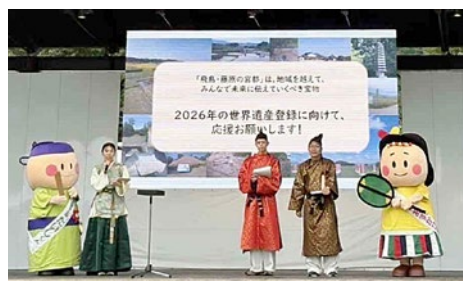
古代衣装で世界遺産登録に向けたPR