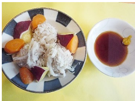
▲キャベツしゅうまい