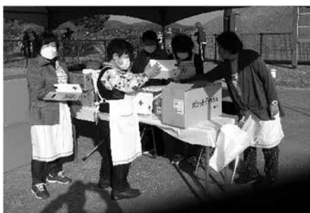
▲村民体育祭での募金活動