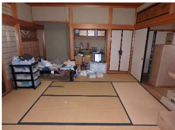
( 1 階 和 室 )