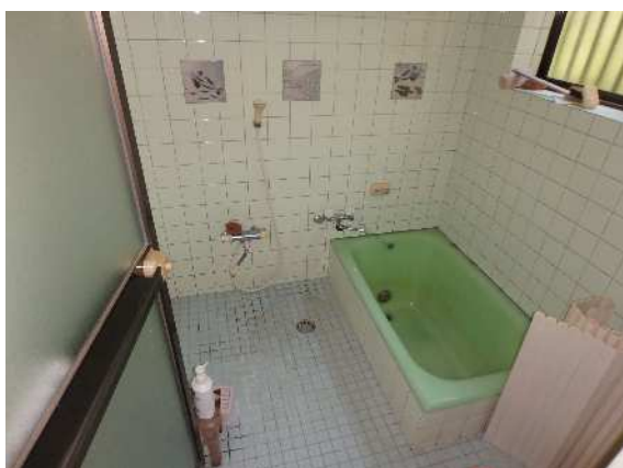
( お 風 呂 )