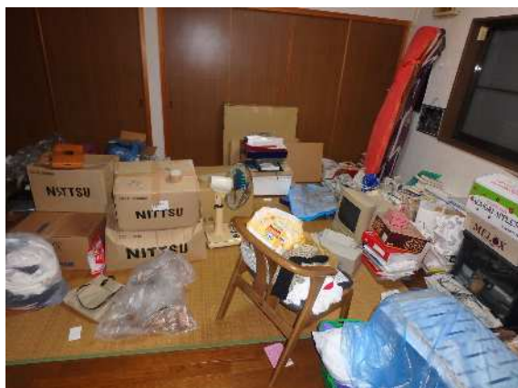
( 2 階 洋 室 )