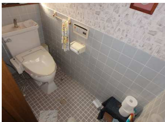
( ト イ レ )