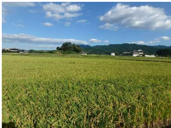
( 前 面 風 景 )