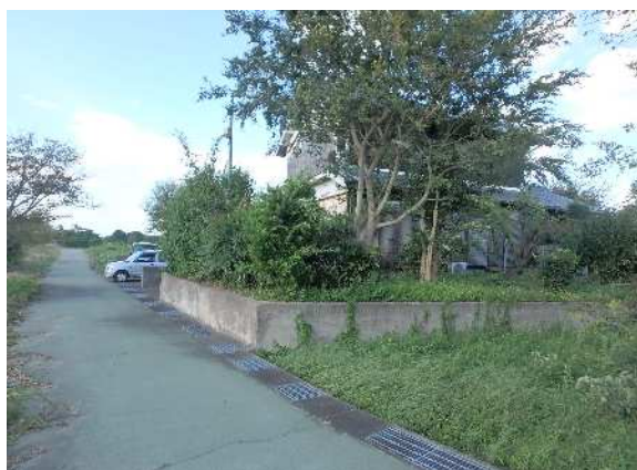
( 前 面 道 路 )