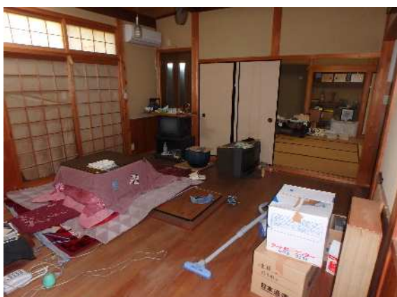
( 居 間 )