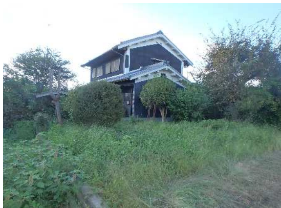
( 外 観 )