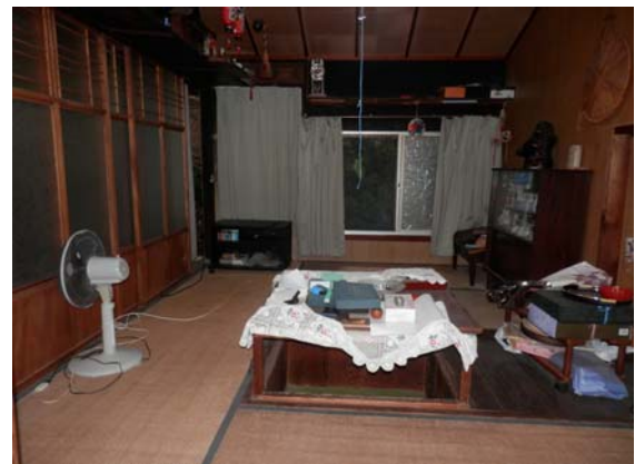
( 6畳和室 )