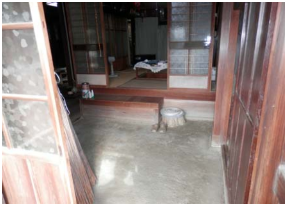
( 土 間 )