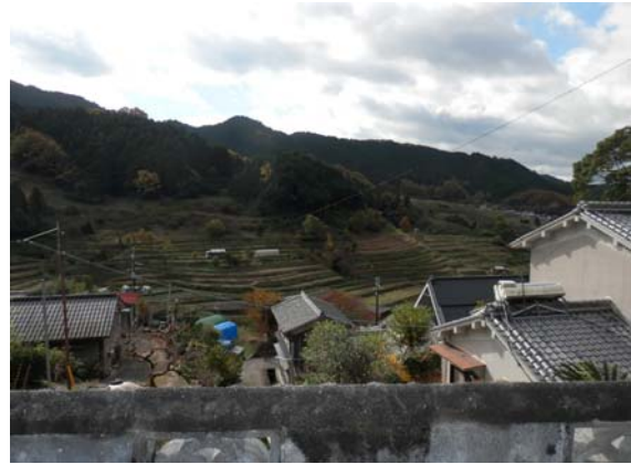
( 物件からの風景 )