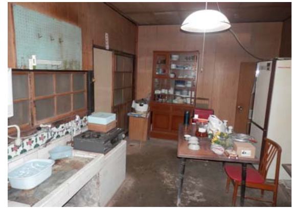
( 台所・土間 )