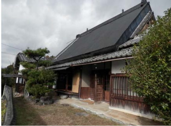
( 外 観 )