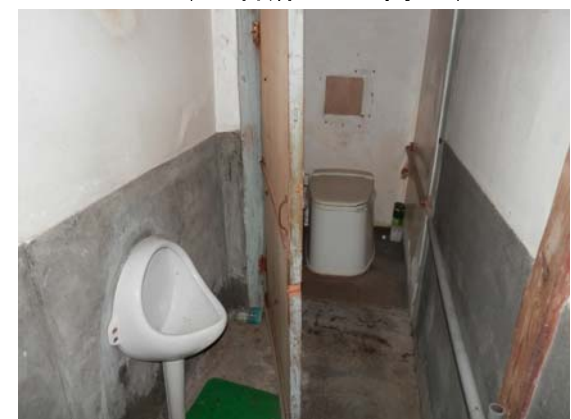
( ト イ レ )