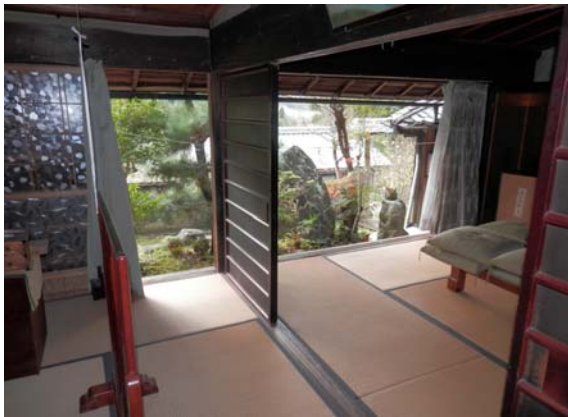
( 4畳和室 8畳和室 )