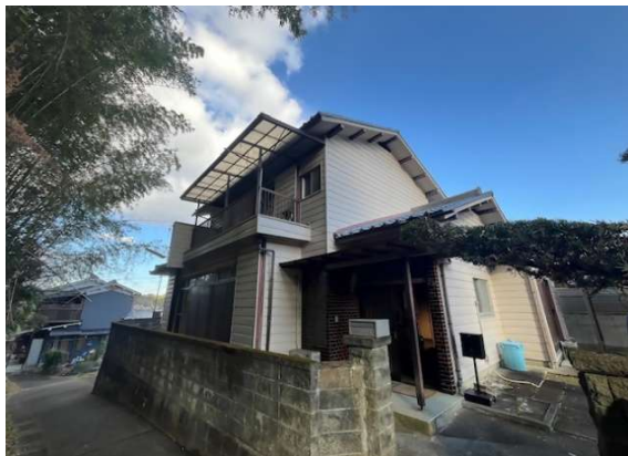
( 外 観 )