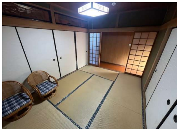
( 1階 和室6畳 )