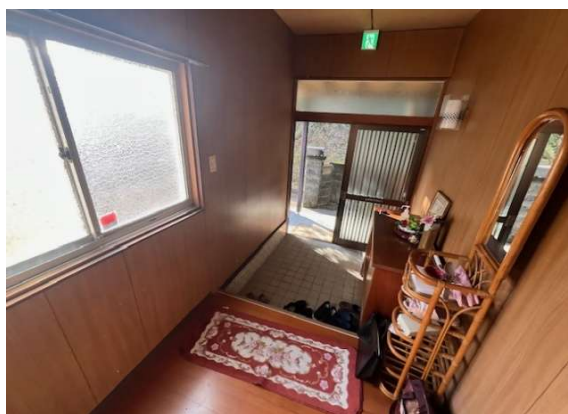
( 玄 関 )