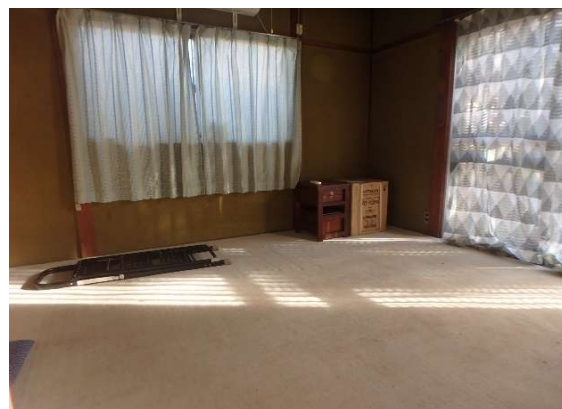
( 1階 和室6畳 )