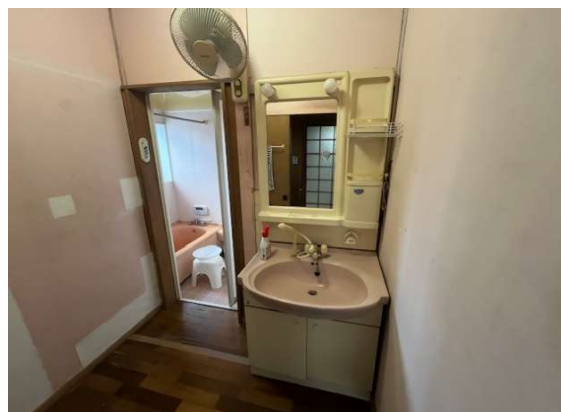
( 洗 面 )