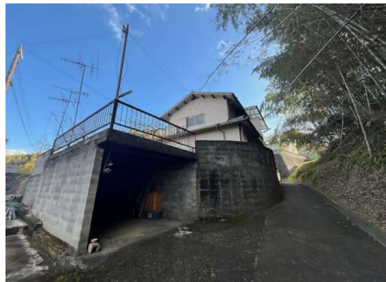
( 外 観 )