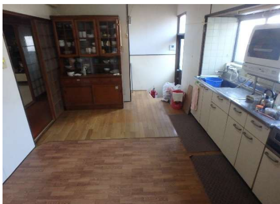
( ダイニングキッチン )