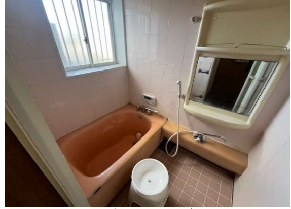
( 風呂 )