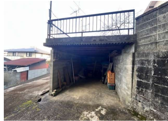
( 地下式倉庫 )