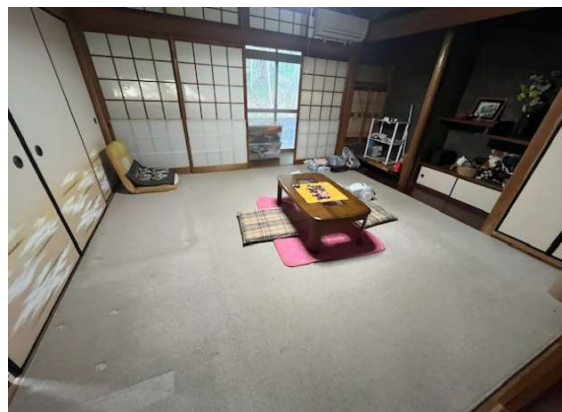
( 1階 和室8畳 )