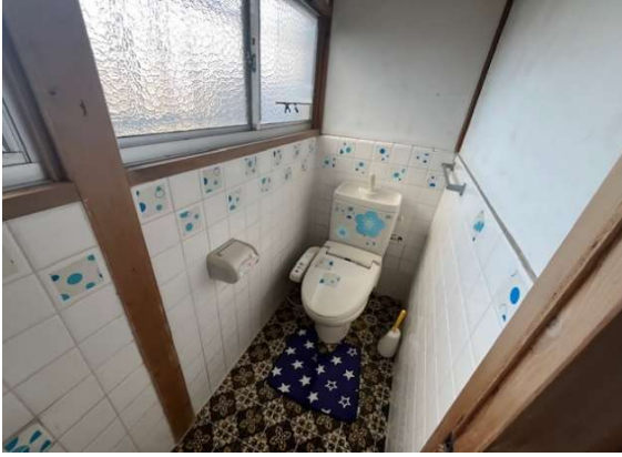
( トイレ )