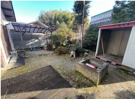
( 庭 )