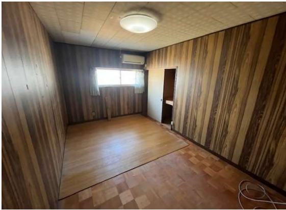
( 2階 居間 )