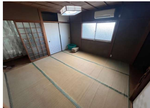
( 2階 和室8畳 )