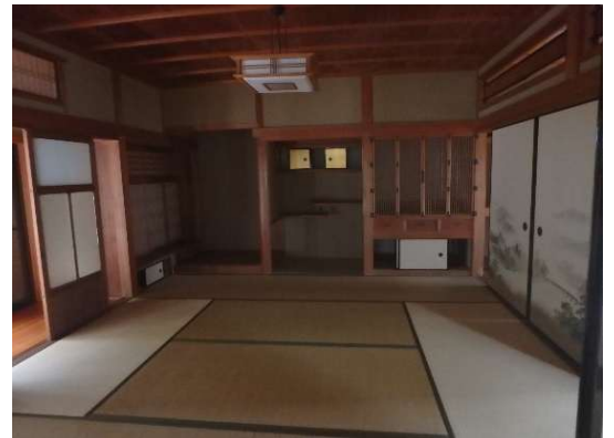
( 1階 和室 )