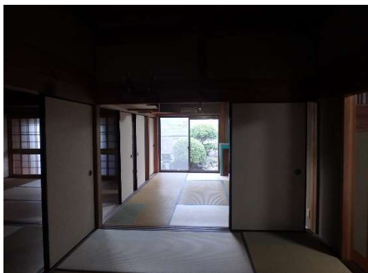
( 1階 和室 )