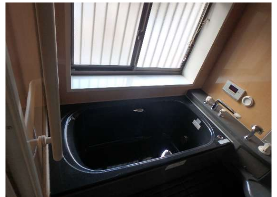
( 風 呂 )