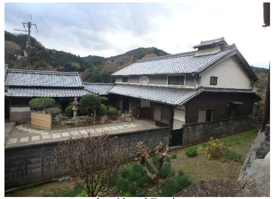
( 外 観 )