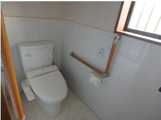
( トイレ )