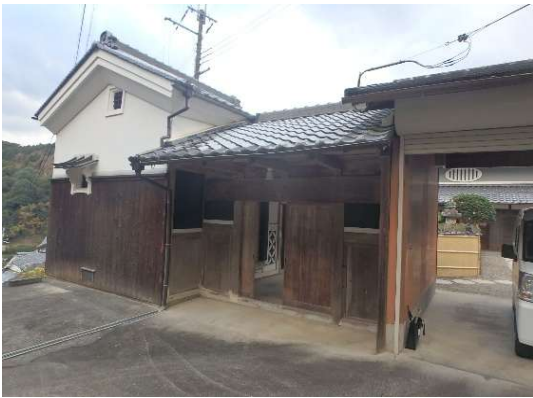
( 門 屋 )