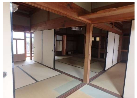
( 1階 和室 )