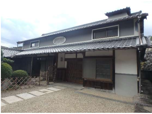
( 外 観 )