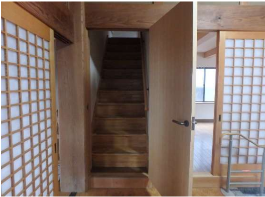
( 階段 (洋間 横) )