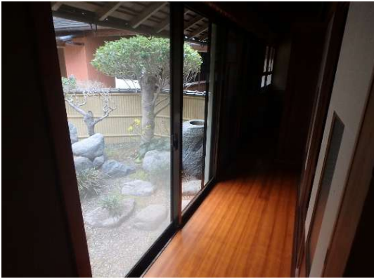
( 広 縁 )