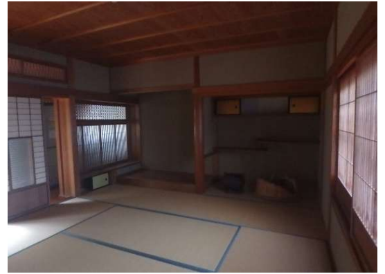
(1階 和室 (4畳) )