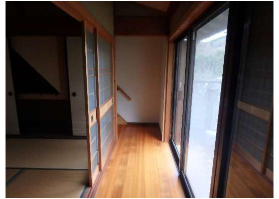
( 縁側～階段 (母屋西側) )