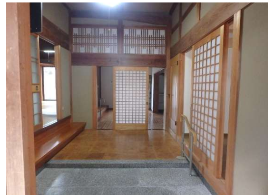
( 玄 関 )