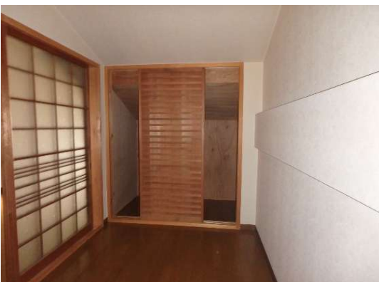
( 2階 階段室 )