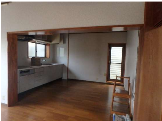
( ダイニングキッチン )