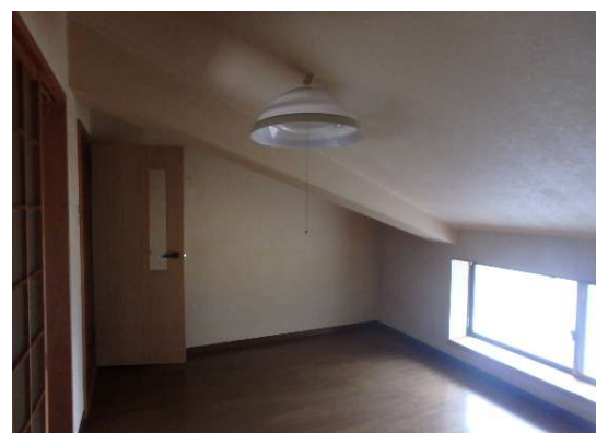
( 2階 洋間 )