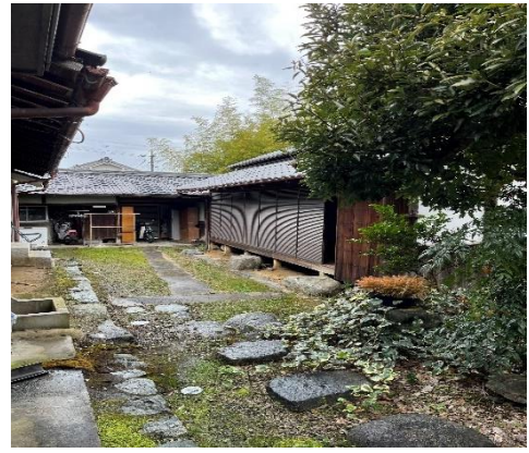
( 裏：離れ家 )