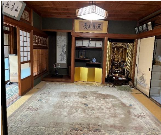
( 和室 8畳 奥の間 )