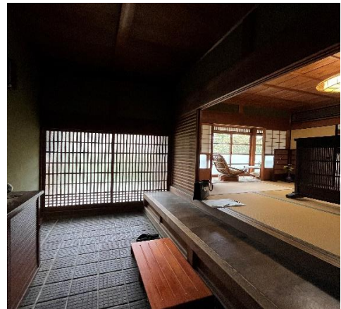
( 玄関 )