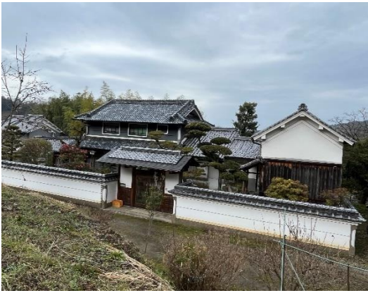
( 外 観 )