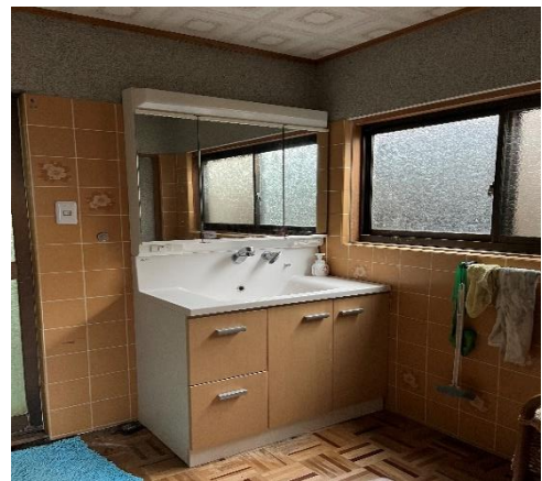
( 洗面・脱衣室 )