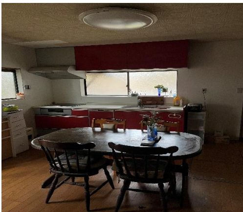
( 台 所 )