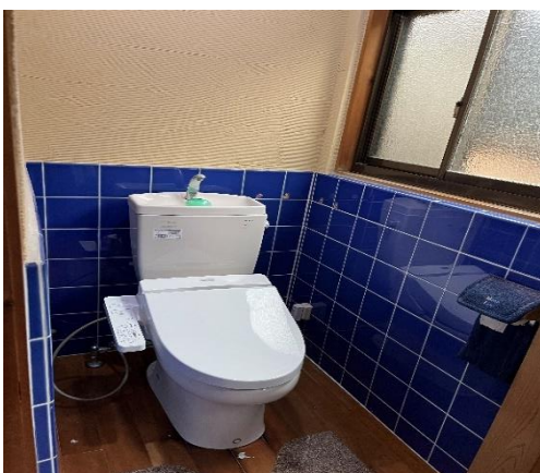
( ト イ レ )