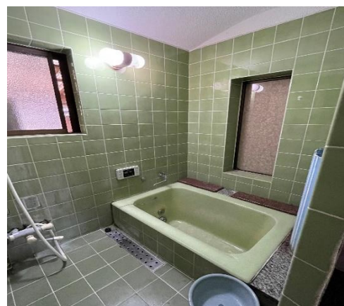
( お 風 呂 )