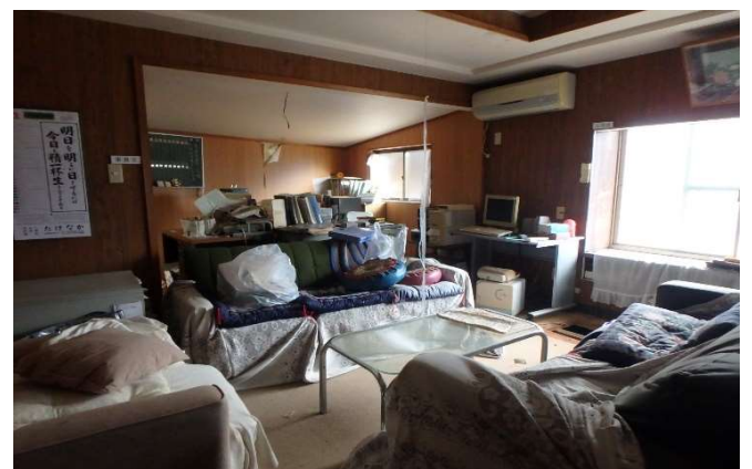
( 洋室 9畳 客間・事務室 )