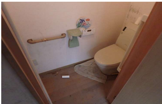
( ト イ レ )