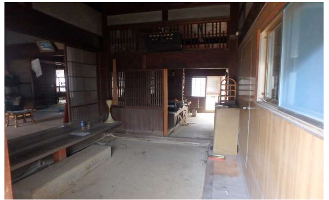
( 玄 関 )