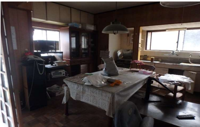
( 台 所 )