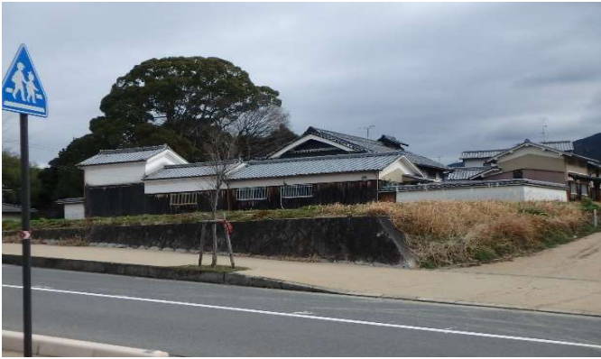
( 外 観 )