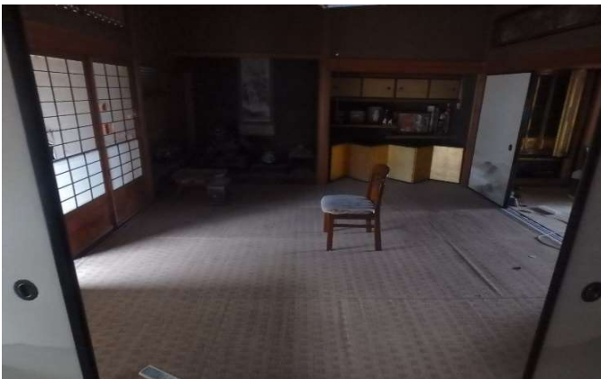
( 和室 8畳 奥の間 )