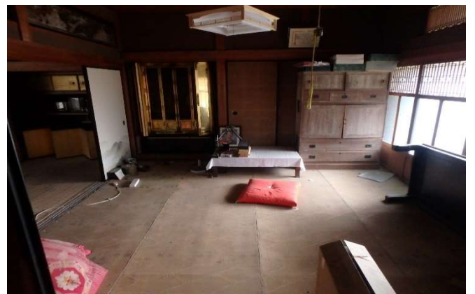
( 和室 8畳 仏間 )