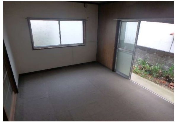
( 1階 洋室 )