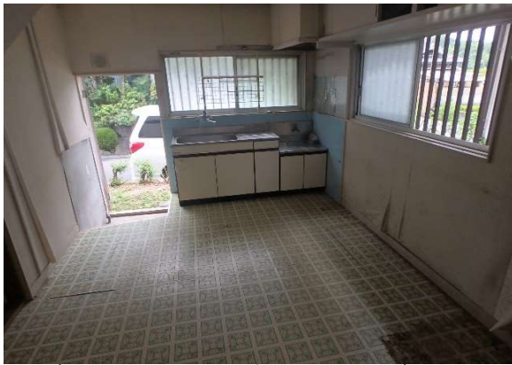
( キッチン・ダイニング )