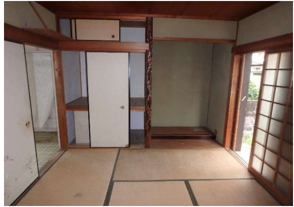
( 1階 和室 )