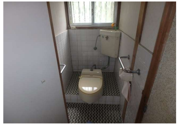
( トイレ )