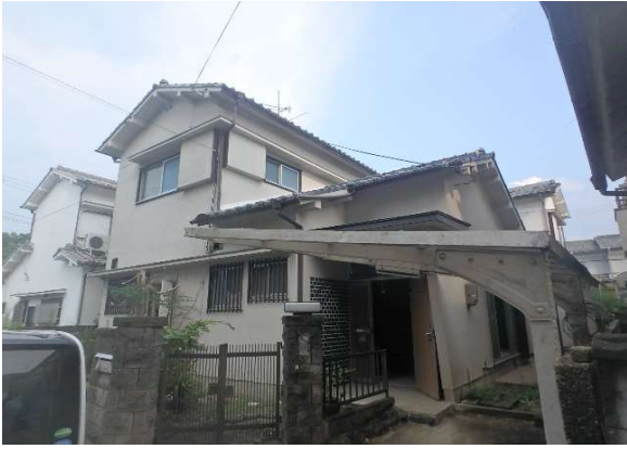
( 外 観 )