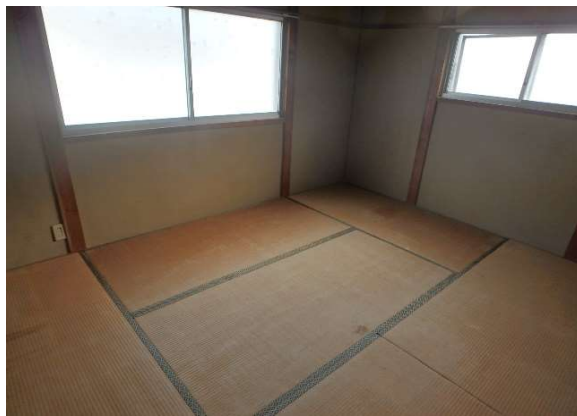
( 2階 和室 )