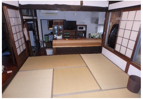
( 和室 )