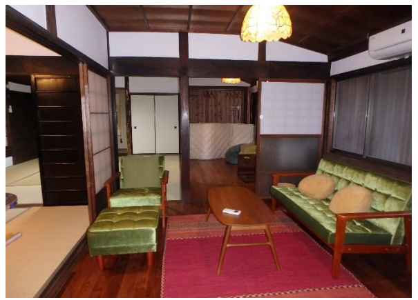
( 洋室 )