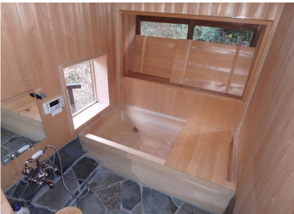
( お風呂 )