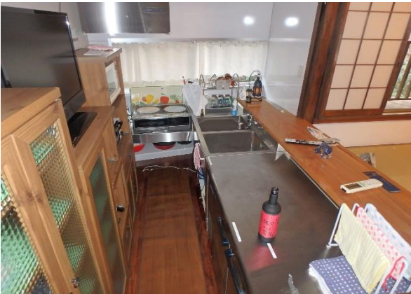
( キッチン )