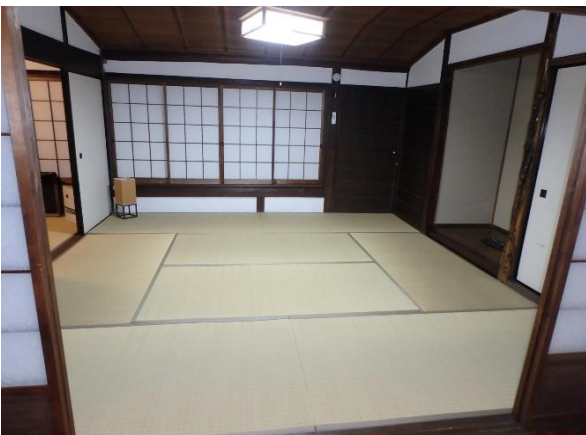
( 和室 )