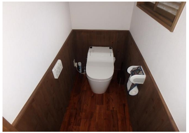
( トイレ )