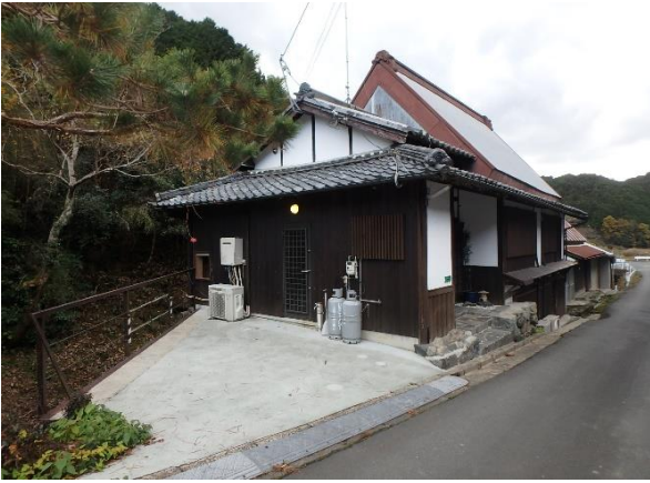
( 外 観 )