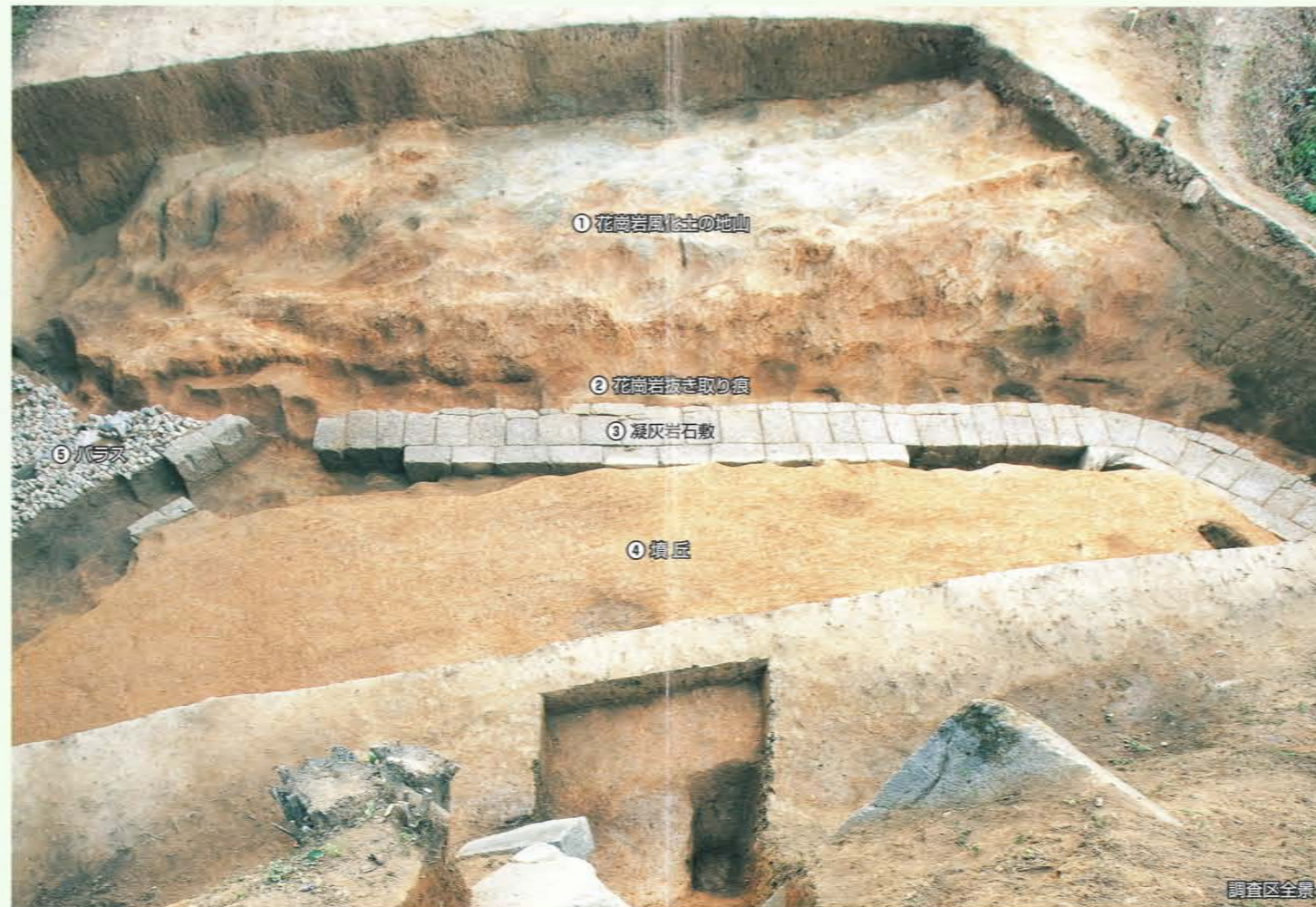
① 花崗岩風化土の地山