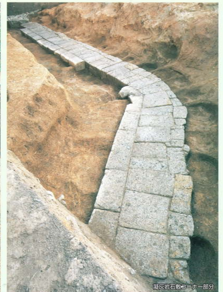
凝灰岩石敷コーナー部分