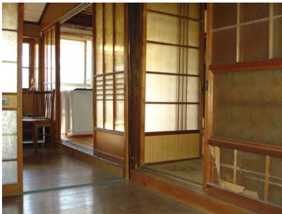
[ 玄関から見たところ ]