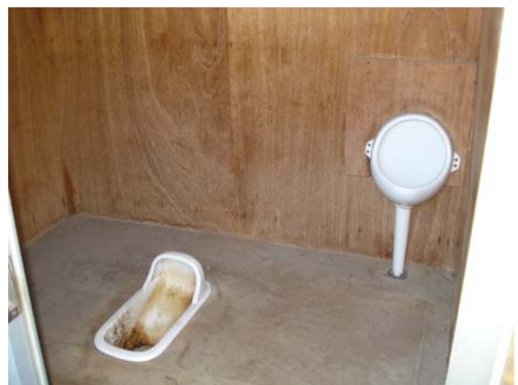
[ ト イ レ ]