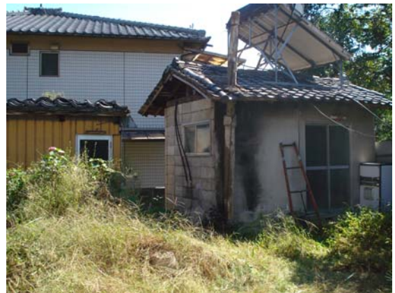
[ 別棟の風呂・トイレ ]