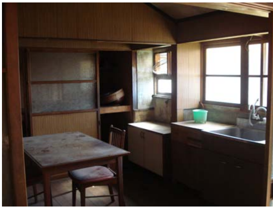
[ 台 所 ]