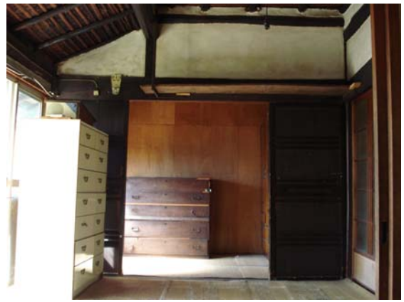
[ 和 室 ]