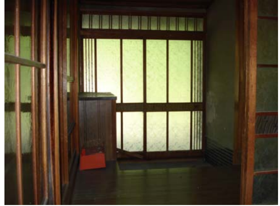
[ 玄 関 ]