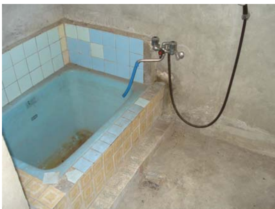
[ 風 呂 ]