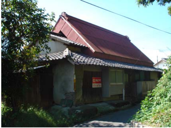
[ 外 観 ]